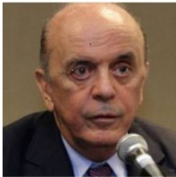
JOSÉ SERRA Cargo atual Sen. PSDB / SP Votou sim nos projetos Reforma da Previdência